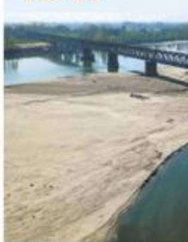
I fiumi sono sempre più in secca