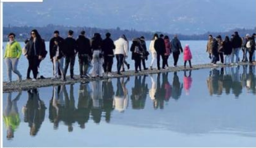
2019/2023 MARCO TACCA

Passerella L'isola dei Conigli, nel lago di Garda, è diventata raggiungibile a piedi a causa del basso livello delle acque